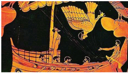
Odiseo resiste en esta pintura el canto de las sirenas