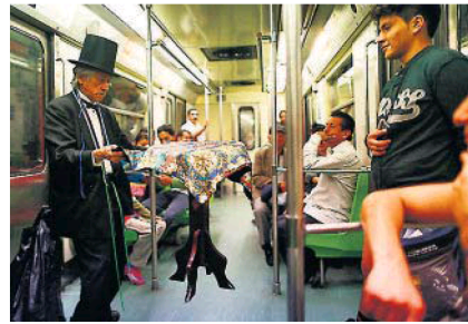
Un mago actúa en el metro de México DF.