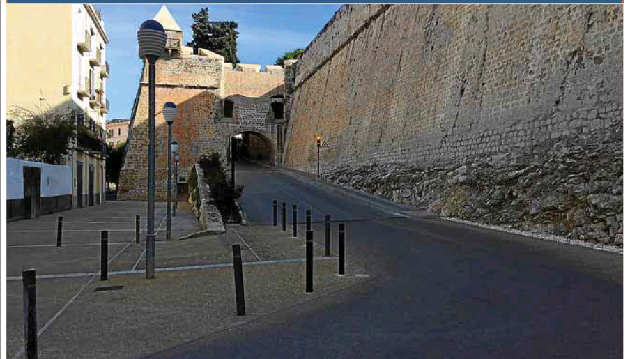
Acceso sin restricciones a Dalt Vila. Vila ha quitado la garita de acceso a Dalt Vila y al barrio de la Marina porque está en licitación el sistema de lectura de matriculas. ■ Foto: A.S.