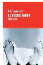
'EL RESUCITADOR' Autor: H. P. Lovecraft. Estilo: Narrativa. Editorial: Periférica. 96 páginas. Cáceres, 2014. Precio: 14,5 euros.

convirtieron «en una mera curiosidad enfermiza y tétrica: sobre los métodos que empleó en los siguientes cinco años no me atrevo a hablar. Me encontraba atado a él por la fuerza bruta del miedo, y en todo ese tiempo fui testigo de cosas que ninguna lengua humana sería capaz de repetir. Poco a poco empecé a darme cuenta de que Herbert West era mucho más horrible que cualquiera de sus actos». A medio camino entre la confesión y lo inefable, 'El resucitador' vuelve con