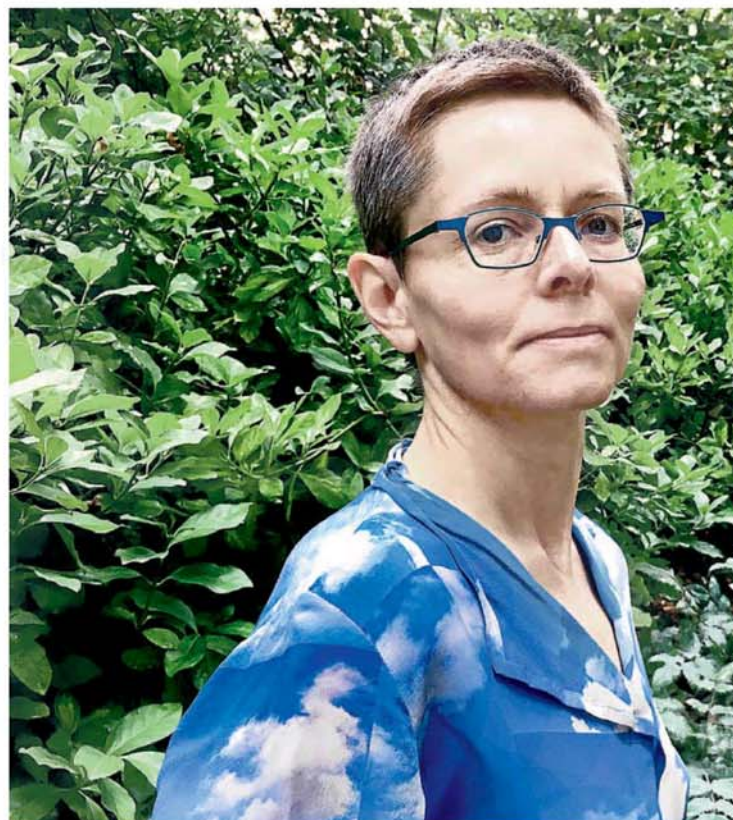
▲ Fotógrafa y escritora. Hélène Gestern, en una imagen de archivo.

– Estoy convencida de que existe una articulación profunda entre el individuo y la comunidad. También esto es algo que nos recuerda hoy en día la epidemia: es porque somos seres sociables por lo que la repentina privación de contactos y de la inclusión en el espacio colectivo nos desestabiliza. No hay duda de que a escala de una sociedad, una nación,