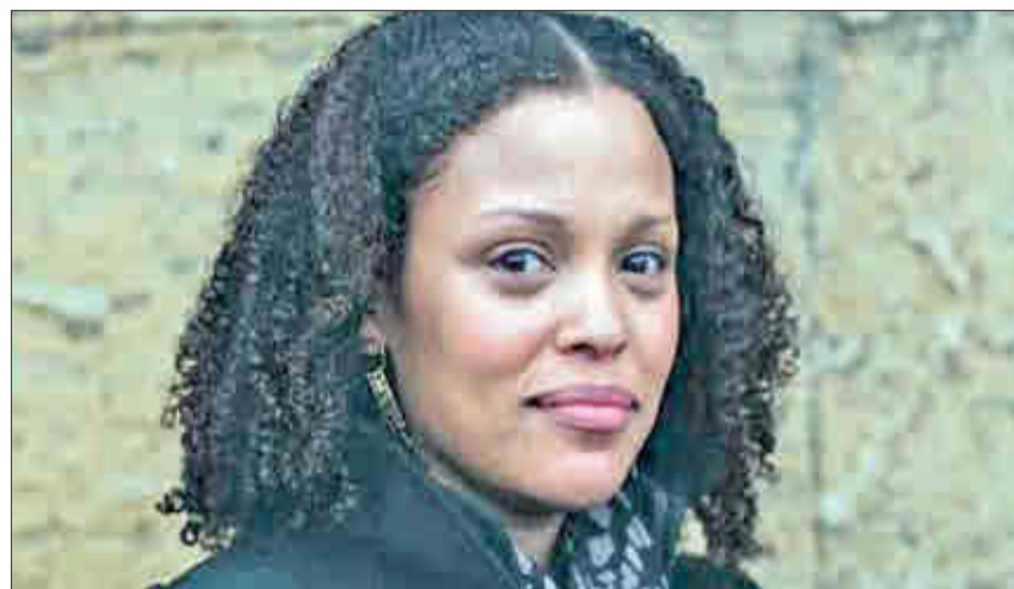
Jesmyn Ward.

que le gusta pensar que sabe lo que es la muerte. Ayuda a su abuelo, Pop, a sacrificar una cebra e intenta no estremecerse cuando éste le corta la garganta o se desliza sobre el suelo encharcado de sangre mientras la despellejan. No deja de ser una comprensión complicada de la masculinidad tanto por los lugares como por las personas de la familia que pueblan el relato de Ward, igual de profundo que el viejo sur más profundo: una pequeña epopeya con antecedentes en Beloved , de Toni Morrison, y que destila remotos ecos Faulknerianos de los Bundren de Mien-