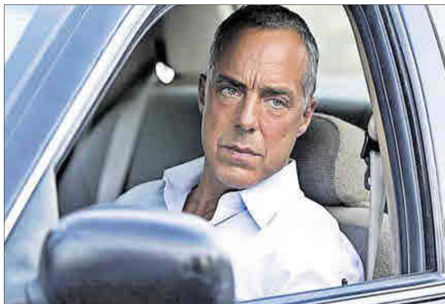
El actor Titus Welliver es Harry Bosch en la serie de Amazon Prime sobre el personaje.

Connelly, que comenzó su trayectoria como periodista de sucesos, siempre ha comentado que fueron los relatos de Raymond Chandler y su detective Philippe Marlowe los que acabaron arrastrándolo al