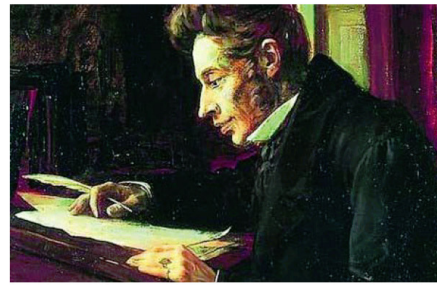
Retrato del filósofo danés, uno de los más grandes pensadores de la historia