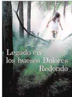
'LEGADO EN LOS HUESOS' Autora: Dolores Redondo. Estilo: Novela. Editorial: Destino. Barcelona 2013. 556 páginas. Precio: 18,5 euros.

pueden retirarse los tablores entrelazados para que no se derrumbe todo el armazón. Dolores Redondo sabe, cada vez mejor, cómo controlar los resortes de la narrativa negra para que el lector no se separe de ella en ninguna página, ya sea dándole sangre y sombras, o relaciones humanas. Y manteniendo la expectativa de cara a la última parte de la trilogía.