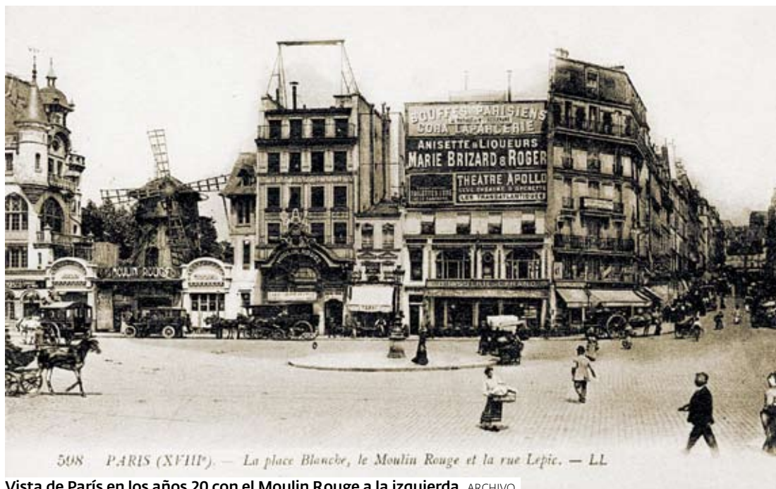
508. PARIS (XVIII*). — La place Blanche, le Moulin Rouge et la rue Lepic. — Vista de París en los años 20 con el Moulin Rouge a la izquierda.

El volumen está formado por 88 documentos con entrevistas, y cartas, diálogos y semblanzas en las que algunos autores relatan su encuentro con él, como Ramón Gómez de la Serna, Rafael Alberti, Ramón Gaya, Carmen Conde y Rafael Casinos Assens.